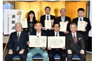
<加工食品コンクールの表彰式>