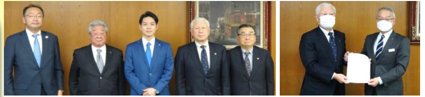
<北海道への要請、知事との意見交換>