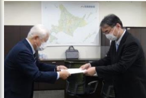
<北海道農政事務所への要請>